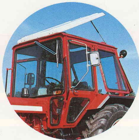
Ny välventilerad säkerhetshytt "original". Bra runtom-sikt. Riktig förarstol. Lättåtkomliga reglage och spakar.