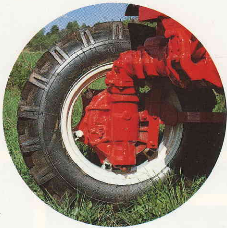
Fjädrande framaxel med överbelastningsskydd. Hög markfrigång (64 cm). Automatisk differentialspärr.