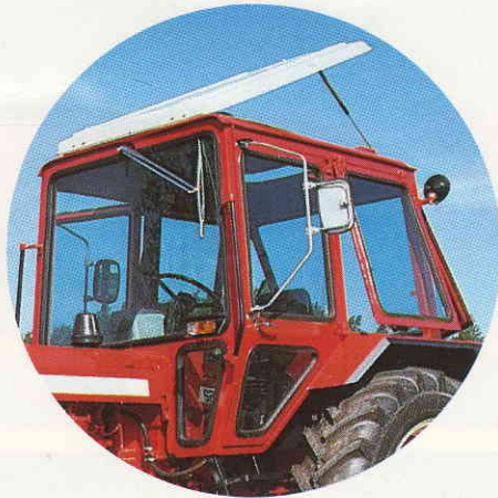
Ny välventilerad säkerhetshytt "original". Bra runtom-sikt. Riktig förarstol. Lättåtkomliga reglage och spakar.