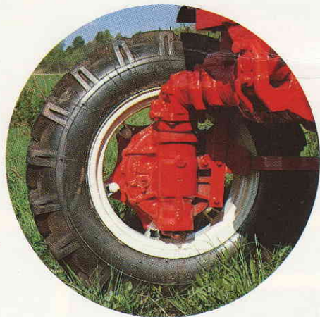
Fjädrande framaxel med överbelastningsskydd. Hög markfrigång (64 cm). Automatisk differentialspär.